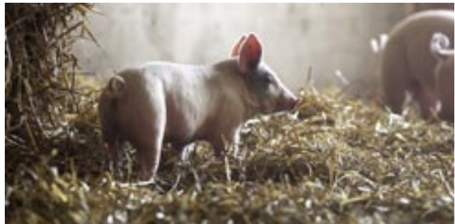
Länstyrelsens djurskyddskontroller visar att svenska grisar har det bra.