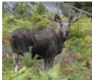
Schmallenbergvirus har, förutom får och kor, även infekterat älg.

Resultaten hittills visar att en stor andel av provtagna besättningar hade högre halter av antikroppar i tankmjölken i september än vad de hade i april. Eftersom halten antikroppar i tankmjölk är direkt relaterad till andelen djur i besättningen som varit infekterade, visar detta att