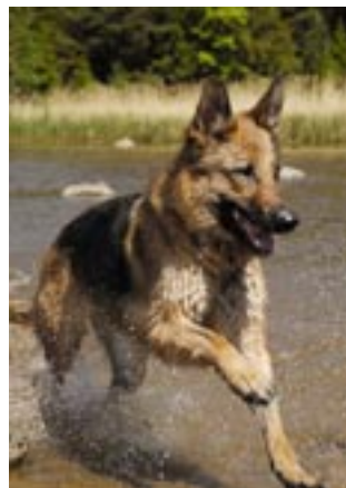
Schäfern är den populäraste hundrasen i Jordbruksverkets hundregister.