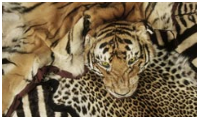
Förbjudna souvenirer som konfiskerats från hemvändande turister visas på Naturhistoriska riksmuseet.

Om du är osäker är det bättre att avstå från att köpa souveni-