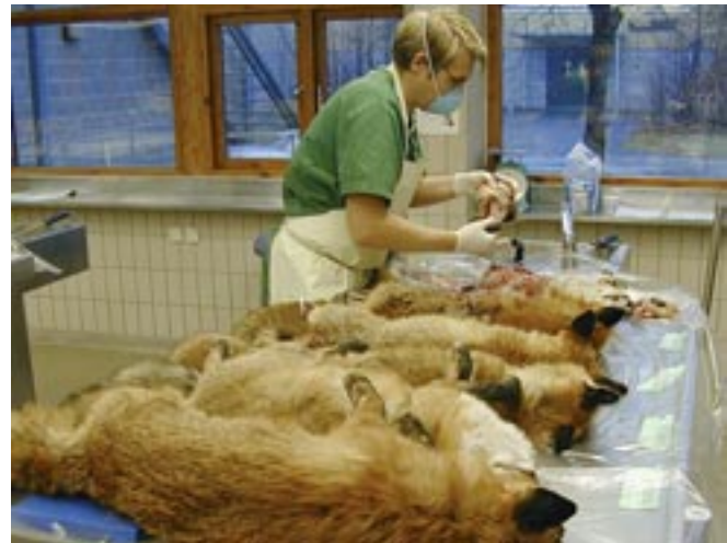
SVA-personal tar hand om insända rävar.