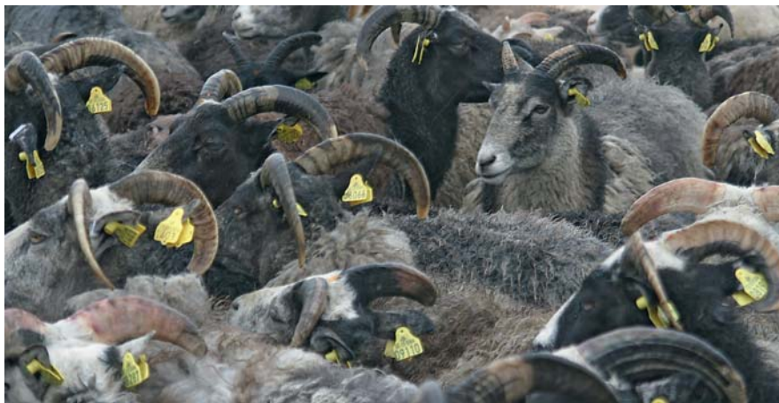
Nu har vi vaccinerat massor av får och lamm.