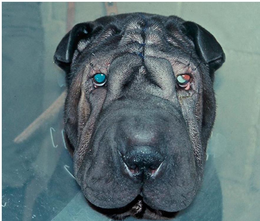
Shar pei har stora problem med hudveck som skaver mot ögat och orsakar sår på hornhinnan. För att förhindra detta "tackas" hundarna, det vill säga, man opererar både övre och undre ögonlocken. Ibland måste även huden på hjässan sys upp.

Rasen basset hound utgör ett annat exempel där avelsarbetet inte alltid stimulerar möjlighet till naturligt beteende för hunden. Svenska prisbelönta topphundar i rasen är framavlade så att de har svårt att röra sig utan att släpa